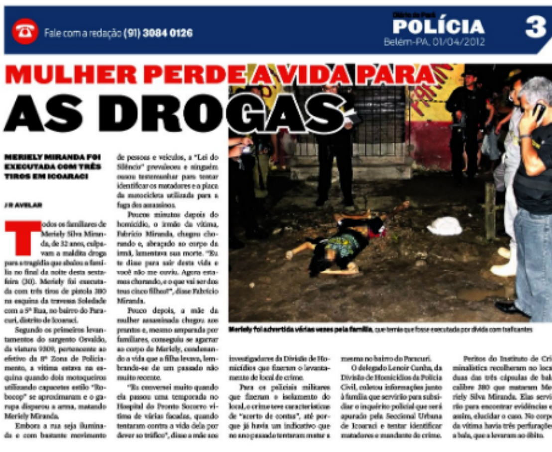
Figura 2: Reprodução Fotográfica do Diário do Pará. “Mulher perde a vida para as drogas”.

Fonte: Jornal Diário do Pará. Belém, 01 de abril de 2012. p.3.