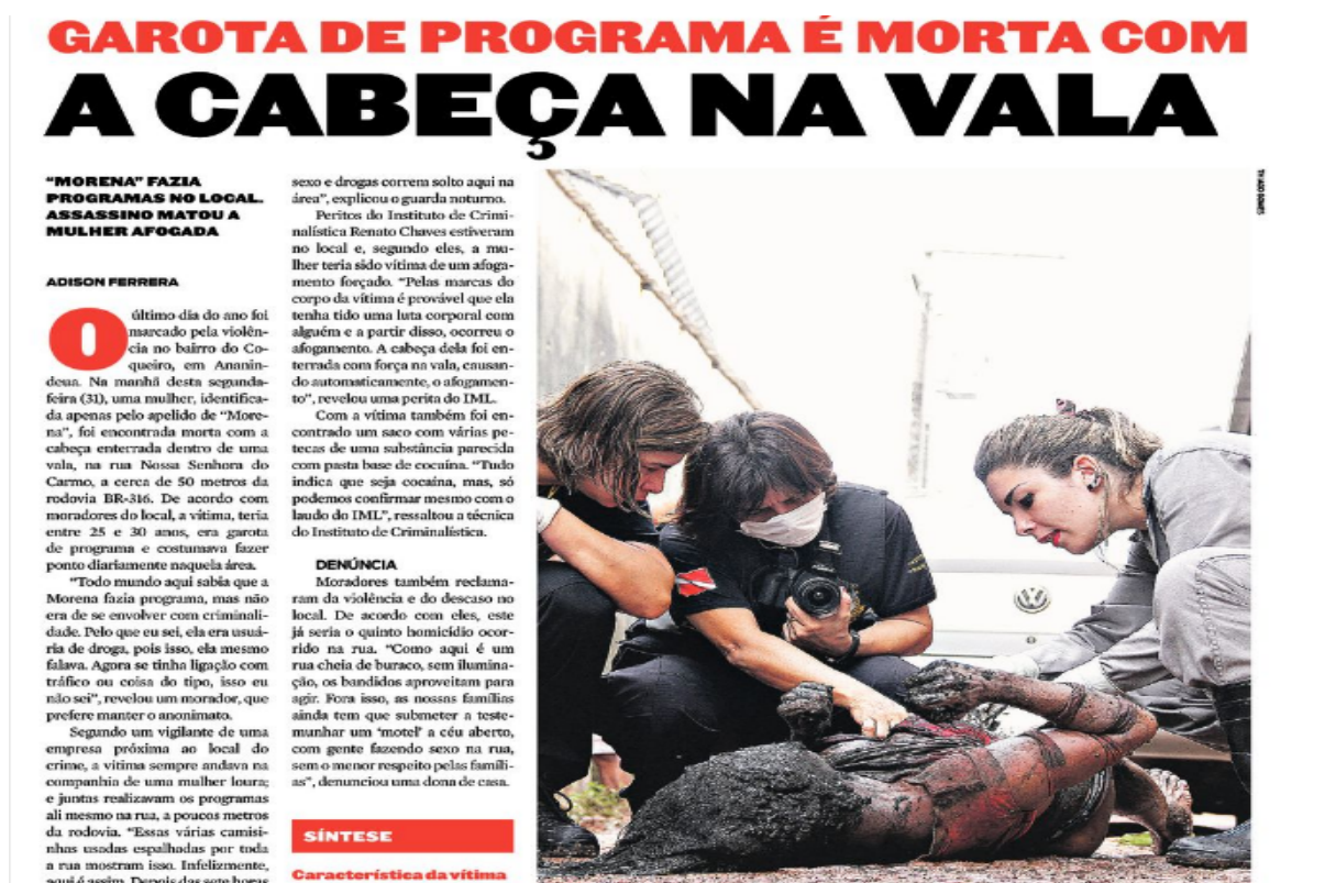
Figura 5: Reprodução Fotográfica do Diário do Pará. “Garota de programa é morta com a cabeça na vala”.