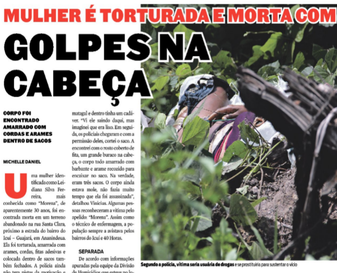
Figura 6: Reprodução Fotográfica do Diário do Pará. “Mulher é torturada e morta com golpes na cabeça”.

Fonte: Diário do Pará. Belém, 14 de outubro de 2014. p. 3.